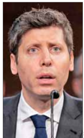
Sam Altman, de OpenAI.

seguridad hasta estafas a escala industrial.