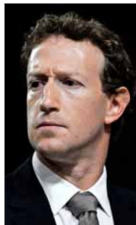
Mark Zuckerberg, de Meta.