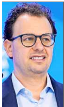
Dario Amodei, de Anthropic.

Después de Myths, un enfoque laissez-faire ya no es políticamente viable ni estratégicamente sensato.