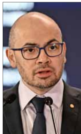
Demis Hassabis, de Google DeepMind.