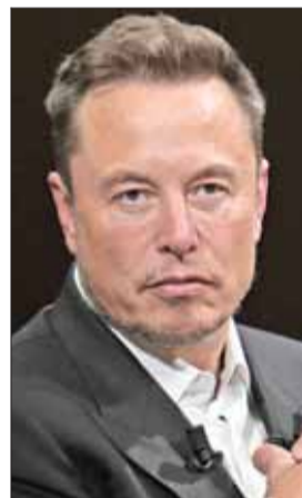
Elon Musk, de xAI.